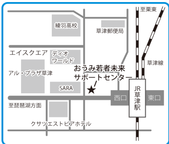
◆おうみ若者未来サポートセンター(草津) 〒525-0025 滋賀県草津市西渋川1丁目1-14 行岡第一ビル4階

おうみ若者未来サポートセンター TEL.077-563-0301 http://www.shiga-yjob.com/ またはヤングジョブセンター滋賀 彦根相談コーナー TEL.0749-24-1304